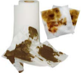
SERVILLETAS Y PAPEL DE COCINA USADO