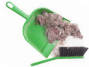
RESTOS DE BARRIDOS

CUALQUIER RESIDUO DOMÉSTICO QUE NO TENGA SU CONTENEDOR ESPECÍFICO