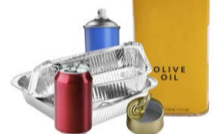
ENVASES METÁLICOS Y LATAS