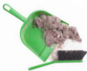
RESTOS DE BARRIDOS