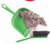
RESTOS DE BARRIDOS