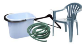
OBJETOS DE PLÁSTICO QUE NO SEAN ENVASES