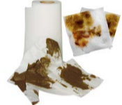
SERVILLETAS Y PAPEL DE COCINA USADO