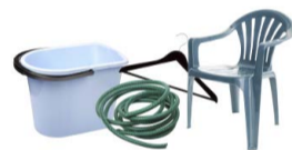
OBJETOS DE PLÁSTICO QUE NO SEAN ENVASES