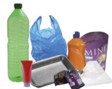
ENVASES DE PLÁSTICO