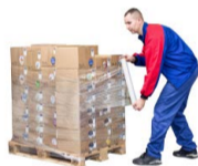
FLEJES, FILM DE RETRACTILAR Y RELLENOS