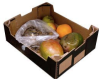
CON RESTOS DE PRODUCTO O COMIDA