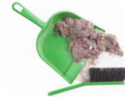
RESTOS DE BARRIDOS

CUALQUIER RESIDUO DOMÉSTICO QUE NO TENGA SU CONTENEDOR ESPECÍFICO