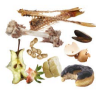
RESTOS DE COMIDA