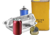
ENVASES METÁLICOS Y LATAS