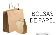
BOLSAS DE PAPEL