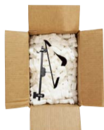
CON PERCHAS, RELLENOS...